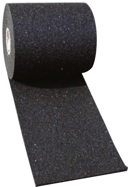
Anti-Rutsch-Matte – Rollenware zum selber Konfektionieren