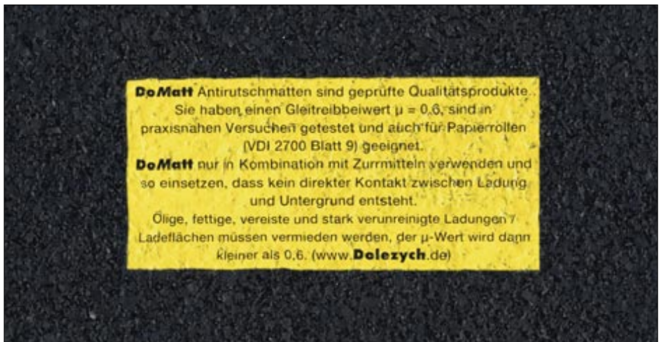
Anti-Rutsch-Matte mit unverlierbarer Kennzeichnung